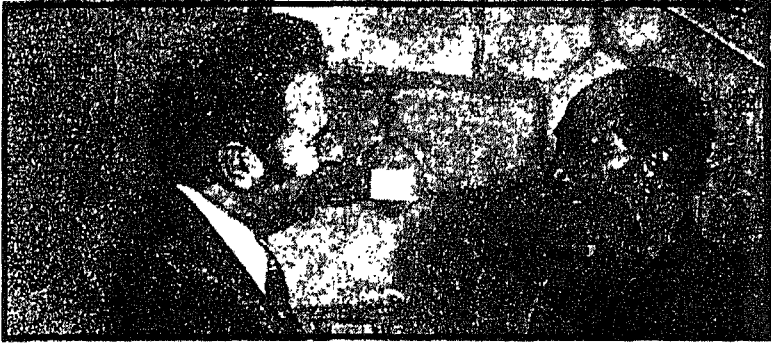
President Sadat and Dr.Falwell enjoying a moment of levity during serious discussions on the Middle East situation